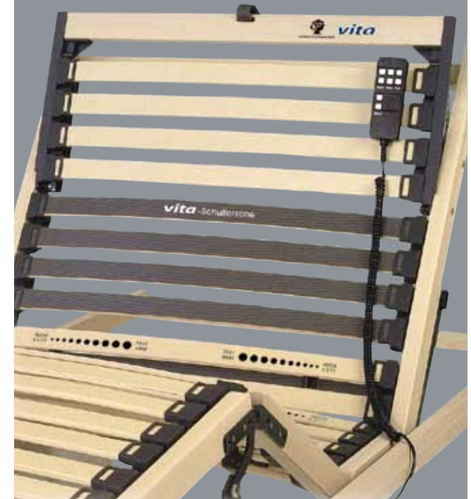
Vita der universelle DORMABELL RAHMEN

Alle dormabell Artikel werden vom eco-INSTITUT auf Humanverträglichkeit geprüft. Sicherheit für Sie.